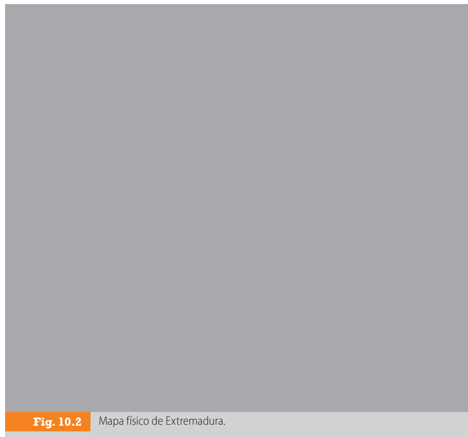
Fig. 10.2 Mapa físico de Extremadura.