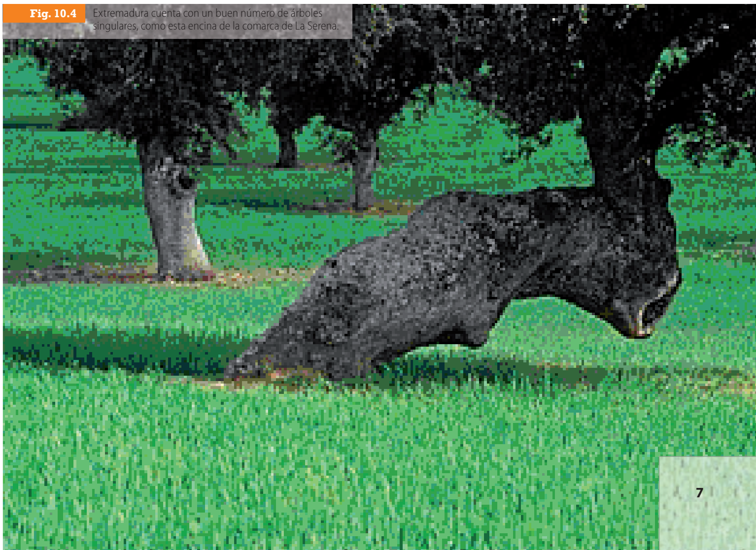
Fig. 10.4 Extremadura cuenta con un buen número de árboles singulares, como esta encina de la comarca de La Serena.