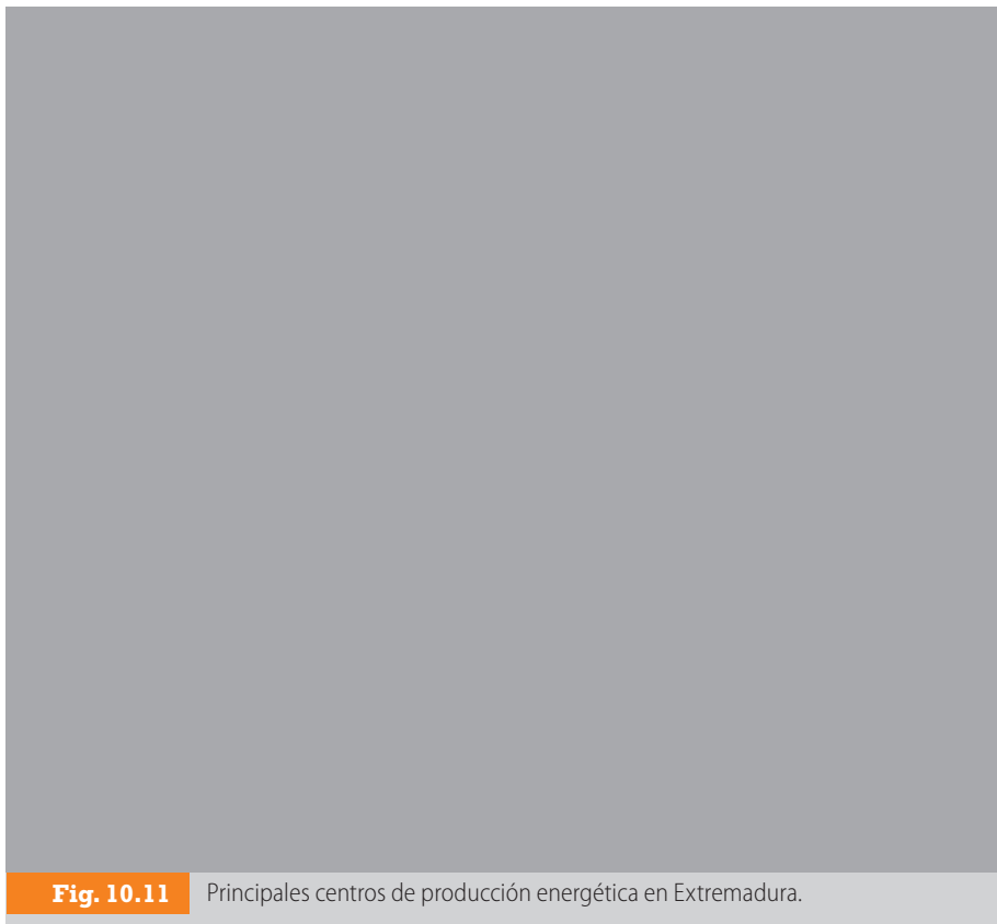
Fig. 10.11 Principales centros de producción energética en Extremadura.

En lo referente a las fuentes de energía renovables, en el año 2005 se estableció la regulación normativa de los parques eólicos de la Comunidad, y durante el año 2006 se empezaron las adjudicaciones de los mismos. Otra alternativa muy rentable en la región es la energía solar en sus dos vertientes, fotovoltaica y termosolar. En Alburquerque (Badajoz) se sitúa el mayor parque solar de España. Por último, mencionar la energía que se puede obtener de los desechos orgánicos vegetales; en la localidad de Los Santos de Maimona (Badajoz) se está instalando una planta de producción de biodiesel a partir de los desechos que genera la industria olivarera.