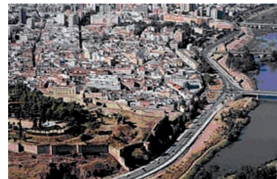
En los últimos años, Extremadura ha experimentado una notable modernización de su red de comunicaciones terrestres. Fig. 10.14

Todas estas mejoras en los transportes repercute positivamente en la economía regional, ya que facilita el transporte de mercancías y el comercio, así como el asentamiento de nuevas industrias.