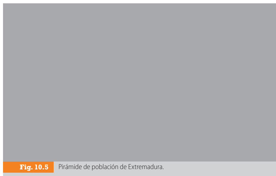
Fig. 10.5 Pirámide de población de Extremadura.

La población total de Extremadura en el año 2006 era de 1 084 599 habitantes. A principios de 1900 era de unos 800 000 habitantes, de lo que puede deducirse que a lo largo del siglo xx el crecimiento demográfico ha sido muy lento. La causa principal de este hecho hay que situarla en la emigración, que afectó principalmente a los jóvenes en edad de procrear, provocando una sistemática reducción de los nacimientos.