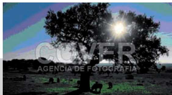
Fig. 10.1 Las dehesas constituyen uno de los paisajes más característicos del ámbito rural extremeño.

En nuestra Comunidad se distinguen tres unidades principales del relieve: los sistemas montañosos , las penillanuras y los valles fluviales . En su conjunto se diferencian siete grandes bloques físicos, que de norte a sur son los siguientes: el Sistema Central, el valle del Tajo, la penillanura cacereña, los Montes de Toledo, las Vegas del Guadiana, la penillanura de la Serena-Tierra de Barros y Sierra Morena.